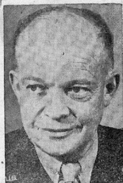
General norteamericano. Nació en Tyler (Tejas) el 14 de octubre de 1890. Estudió en la Academia

de West Point. Ingresó en el ejército con el grado de segundo teniente, ascendiendo por sus propias fuerzas. Su carrera en ese sentido es un modelo de orden. El 30 de noviembre de 1940 fué designado a la jefatura del Estado Mayor del Tercer cuerpo en Fort Leis, (Estado de Washington). En 1941 en el mes de marzo, pasó al Estado mayor del noveno. Tres meses después era destinado al Estado Mayor del Tercer cuerpo de ejército en San Antonio, Tejas. A comienzos de 1942 fué nombrado jefe de la división de planes de guerra del Estado Mayor del Ministerio de la Guerra. El día 2 de abril del mismo año mandaba la división de operaciones. Más tarde le correspondió dirigir las fuerzas de tierra aliadas que desembarcaron en el Norte de Africa el día 8 de noviembre de 1942. La operación fué un modelo de ejecución y preparación. En el mes de febrero de 1943, Eisenhower fué confirmado en el cargo de generalísimo de las fuerzas aliadas en el norte de Africa.